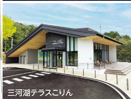
三河湖テラスこりん