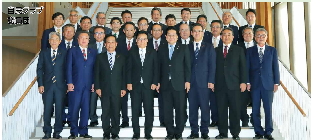
自民クラブ 議員団